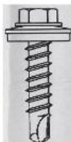
END-Bohrschrauben 5,5x25 Stahlbau