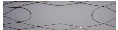
getrenntes Netz für Zylinder