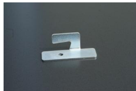
Mittelteil, 3mm vollverzinkt