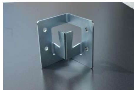
Eckteil, 3mm vollverzinkt